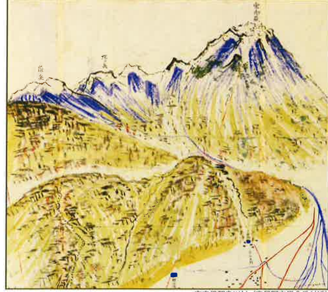
南安曇郡烏川村 (安曇野市常念岳付近)