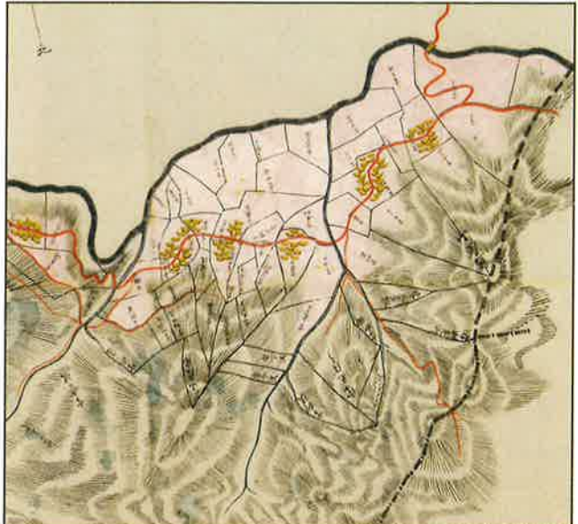
上高井郡奥山田村 (高山村奥山田)