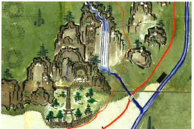
西筑摩郡王滝村 (王滝村御嶽神社里宮付近) ※この地図の原本は「地図見学会」②で公開します。