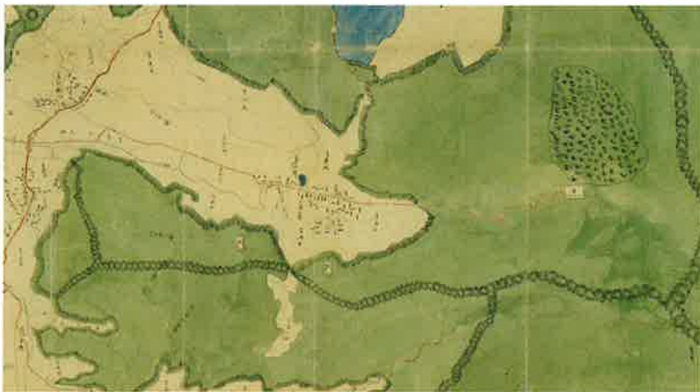
下高井郡高野村 (飯山市瑞穂)