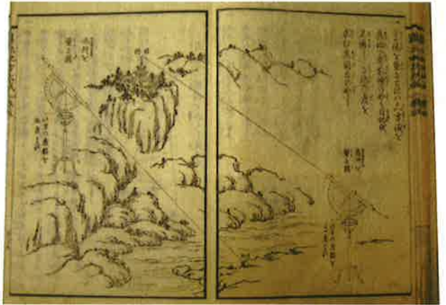
測量の解説「算法地方大成 量地ノ部」(江戸時代)