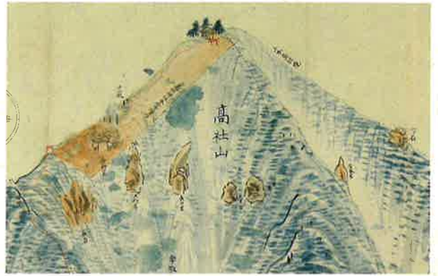
下高井郡科野村 (中野市高社山)