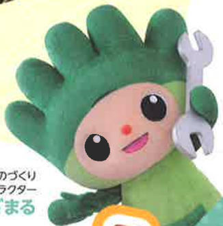
長野県ものづくり 人材育成応援キャラクター わざまる